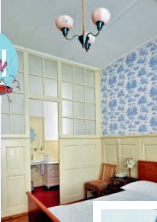
Bellevue des Alpes is alleen bereikbaar per treintje. Maar wat een rit!