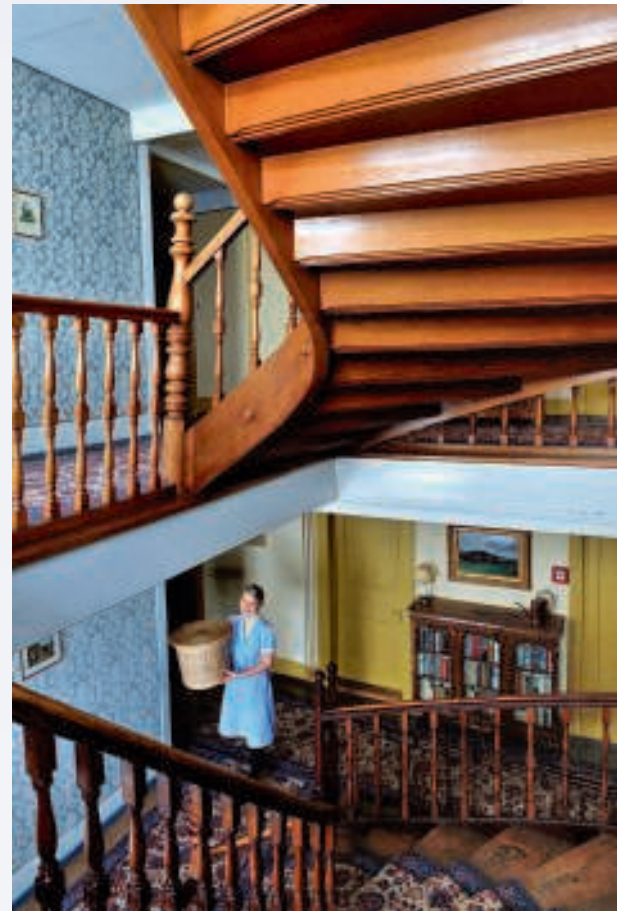
De nostalgische sfeer in Bellevue des Alpes blijft behouden, maar oubollig wordt het nooit.